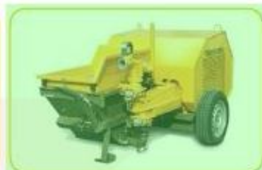
UNI 30 DS