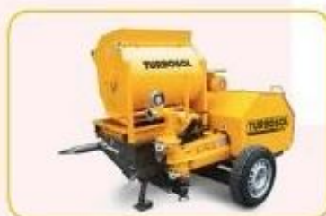
UNI 30 EMF