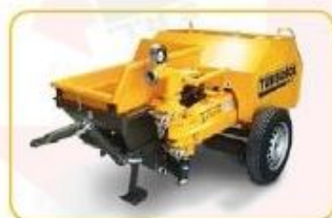
UNI 30 ES