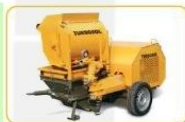
UNI 30 DMF